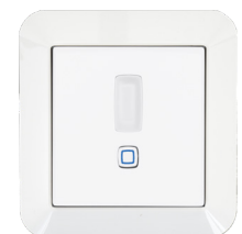
GIRA Standard 55